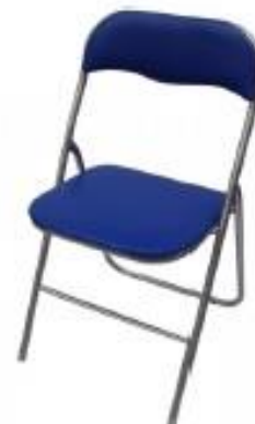
Silla plegable polipiel Azul (S03)