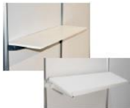
Baldas de Stand (B01)