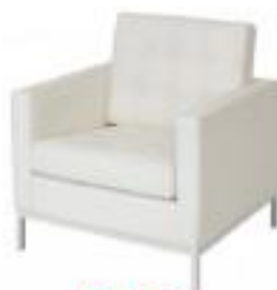
Sillon Flor (CM09)