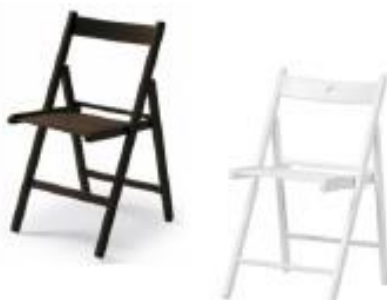
Silla Tijera Teka o Blanca (S05)