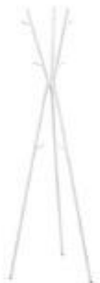
Perchero Pie ó Burra (CM02 - CM03)