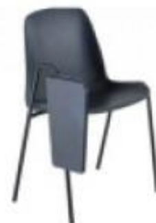
Silla de Pala (S06)