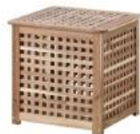
Mesita baja para Sofá/Sillon (CM10)