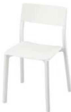
Silla Blanca Polietileno (S02)