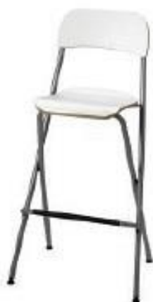
Taburete Madera (T01)