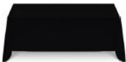
Mesa con Funda (ME04)