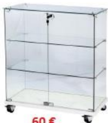
Mostrador Cristal (M03)