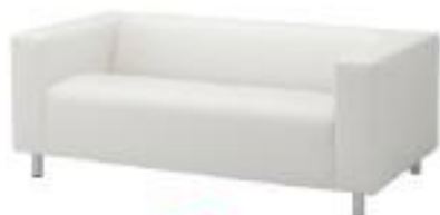
Sofa 2 plazas (CM08)