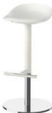
Taburete Hidráulico (T02)