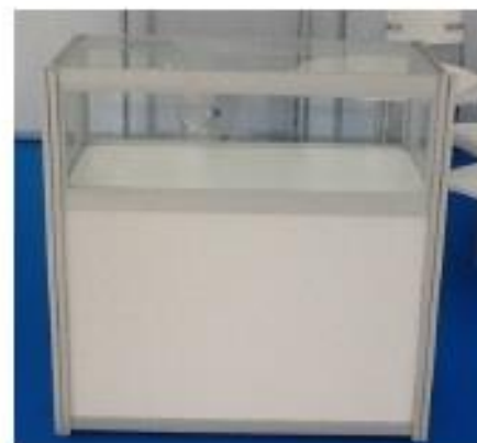
Mostrador Vitrina (M02)