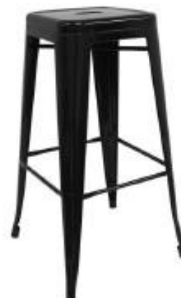
Silla Metalico Tolix (TA03)