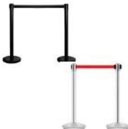
Catenaria Cinta Extensible (CM06)