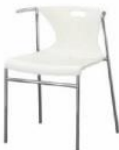
Silla Splash (S04)