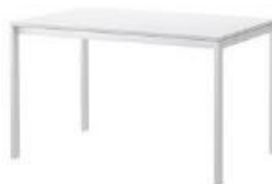
Mesa Rectangular (ME03)