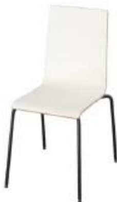
Silla Blanca Madera (S01)

Costes por unidad durante 4 días máximo / 21% iva no incluido