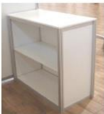
Mostrador cerrado con balda (M01)