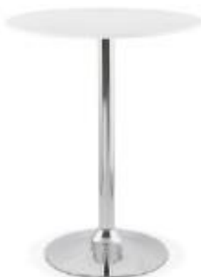
Mesa Alta (ME02)