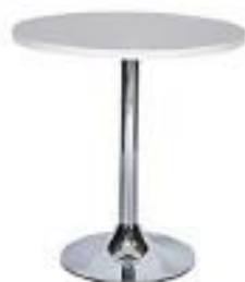
Mesa Baja (ME01)