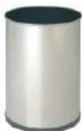
Papelera Metálica (CM05)